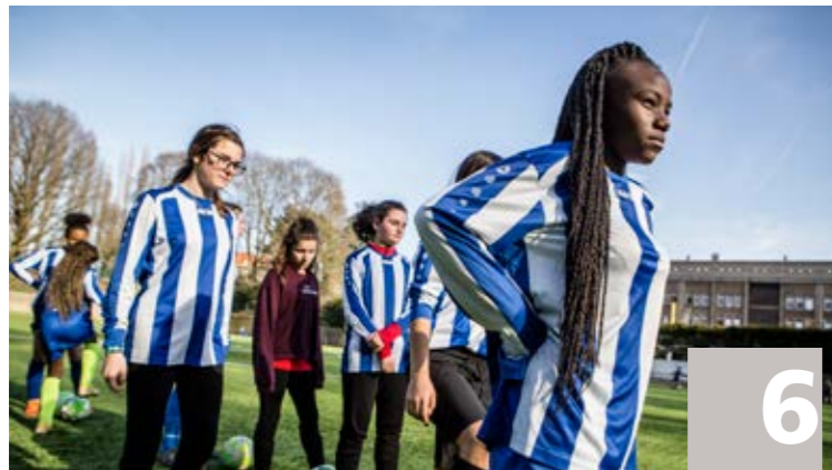
Dossier : Sport et valeurs Dossier Sport en waarden