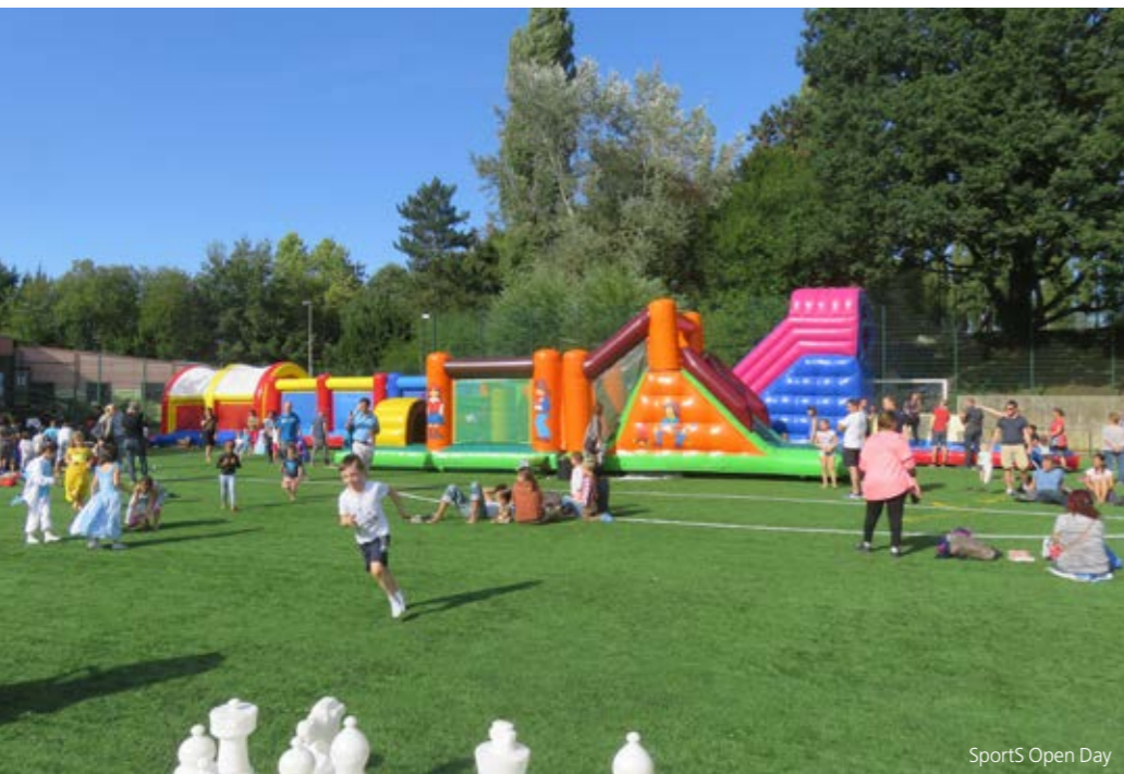
SportS Open Day