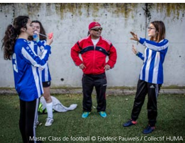
Master Class de football

L'Asbl Panathlon promeut les valeurs qui font du sport une activité où chacun s'épanouit : fair-play, respect, solidarité, fraternité ou encore amitié. Un objectif ambitieux qui ne peut se réaliser qu'avec les acteurs du monde sportif et du monde citoyen. Ainsi, la Commune de Watermael-Boitsfort a réalisé de nombreuses actions pour sensibiliser au fair-play : un arbre a été planté au Parc Sportif des 3 Tilleuls pour rappeler qu'il s'agit d'un espace privilégié de diffusion des valeurs sportives.