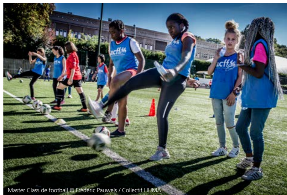
Master Class de football

De vzw Panathlon promoot waarden die van sport een activiteit maken waarbij iedereen zich kan ontplooiën: fair-play, respect, solidariteit, broederschap en ook vriendschap. Een ambitieuze doelstelling die enkel bereikt kan worden met spelers uit de sportwereld én de burgermaatschappij. De gemeente Watermaal-Bosvoorde heeft dan ook veel acties op touw gezet om iedereen voor fair-play te sensibiliseren: er werd een boom geplant in de Sportwarande der 3 Linden die ons eraan moet herinneren dat dit een bevoorrechte locatie is waar sportieve waarden gelden.