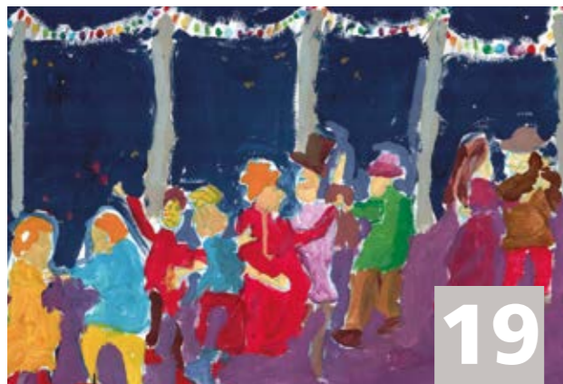
Bal populaire Volksbal